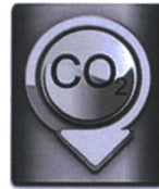
ฉลากลดคาร์บอน