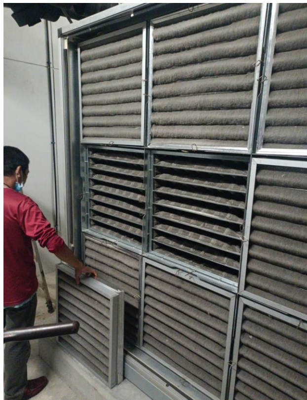
ภาพ 10 ขั้นตอนการติดตั้งล้างฟิลเตอร์แอร์