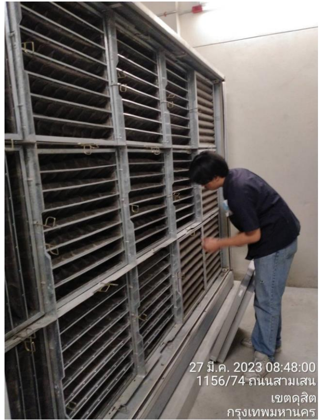
ภาพ 9 ขั้นตอนการถอดล้างฟิลเตอร์แอร์