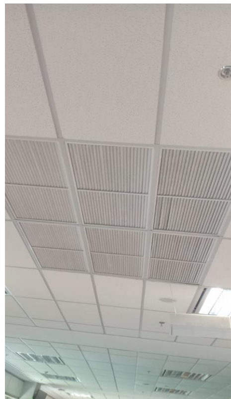
ภาพ 3 รีเทิร์นแอร์ (ลมกลับ) ก่อนทำ