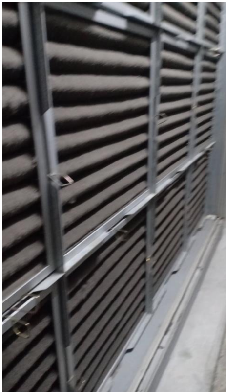
ภาพ 2 ฟिलเตอร์ ก่อนทำ