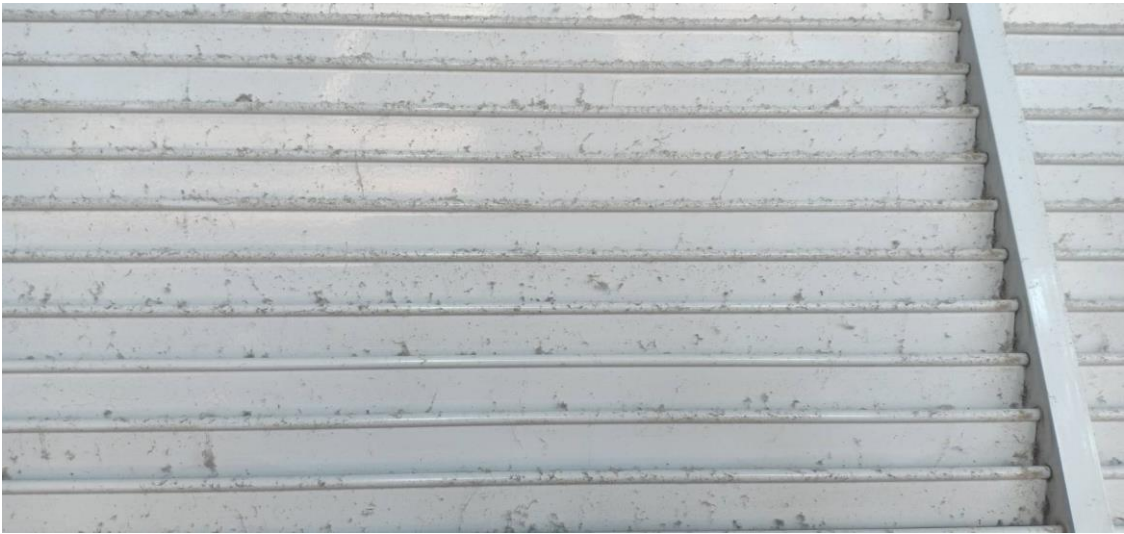
ภาพ 5 หน้ากากกรีเทิร์นแอร์ มีคราบฝุ่นติดที่ตะแกรง