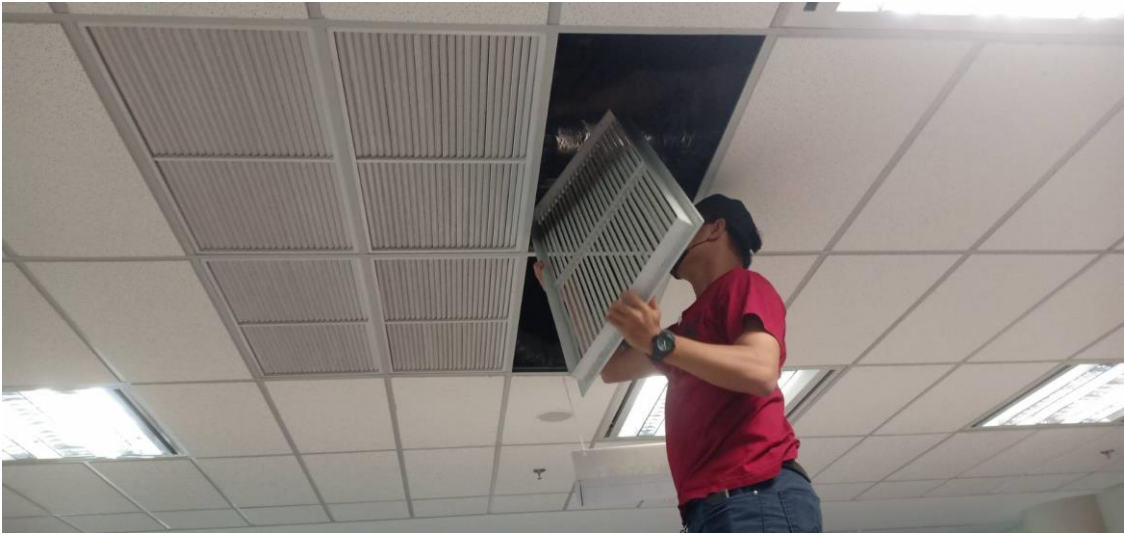
ภาพ 4 ขั้นตอนการถอดหน้ากากกรีเทิร์นแอร์ (ลมกลับ) ระหว่างดำเนินการ