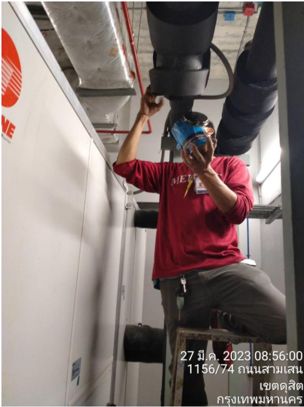
ภาพ 8 ขั้นตอนการล้างสแตนเนอร์ (อุปกรณ์ดักสิ่งสกปรก)