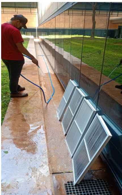
ภาพ 6 ล้างหน้ากากกรีเทิร์นแอร์