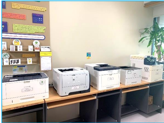
จุดวางเครื่องพิมพ์ กลุ่มงานบริหารทั่วไป

กำหนดจุดจัดวางเครื่องเขียนและวัสดุอุปกรณ์สำนักงาน เพื่อใช้งานร่วมกันของแต่ละกลุ่มงานฯ