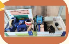
ก.งานภาษาฝรั่งเศส รัสเซียและอิตาลี