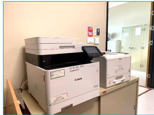
จุดวางเครื่องพิมพ์ กลุ่มงานภาษาจีนและภาษาอื่น