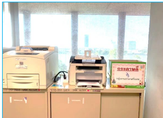
จุดวางเครื่องพิมพ์ กลุ่มงานภาษาฝรั่งเศส รัสเซีย และอิตาลี