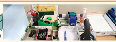
หมวด 3 การใช้ทรัพยากรและพลังงาน

กำหนดจุดจัดวางเครื่องเขียนและวัสดุอุปกรณ์สำนักงาน เพื่อใช้งานร่วมกันของแต่ละกลุ่มงานฯ