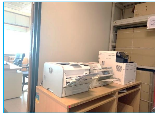
จุดวางเครื่องพิมพ์ กลุ่มงานภาษาอังกฤษ

กำหนดจุดวางเครื่องพิมพ์ใช้ร่วมกันของแต่ละกลุ่มงาน เพื่อลดการสิ้นเปลือง และวางเครื่องพิมพ์ห่างจากผู้ปฏิบัติงาน