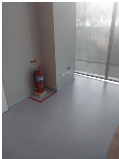
ภาพการวางถังดับเพลิงในห้องประชุมโดยไม่มีสิ่งกีดขวาง