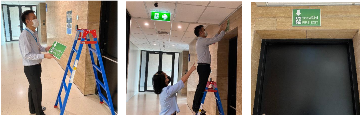
ภาพการติดตั้งป้ายทางหนีไฟ (Fire Exit)