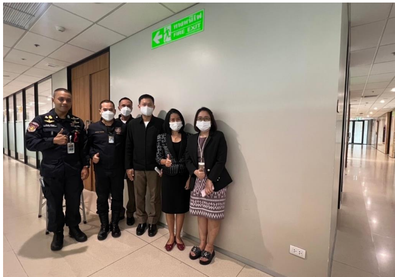
ภาพการติดตั้งป้ายบอกทางหนีไฟเพิ่มเติม