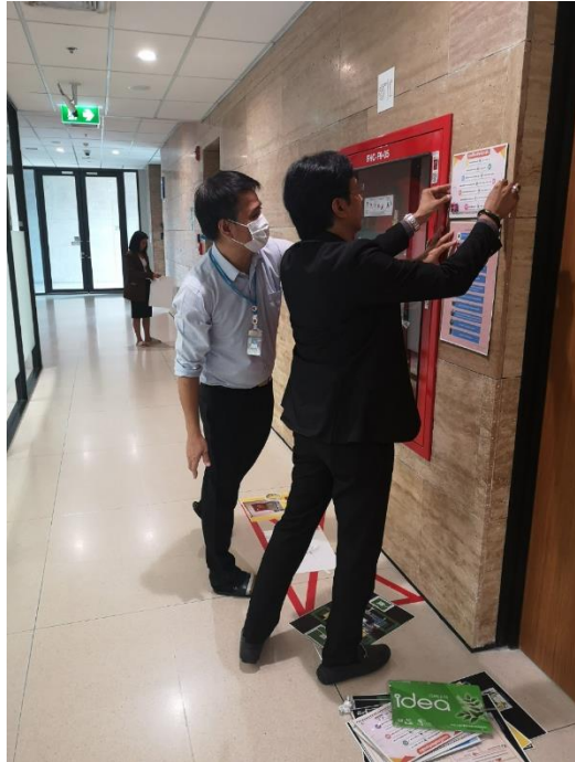
ภาพการติดตั้งรณรงค์ทางหนีไฟ เบอร์โทรฉุกเฉิน คำแนะนำการใช้อุปกรณ์ดับเพลิง