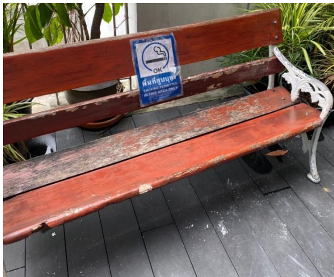
ภาพพื้นที่สูบบุหรี่ของสำนักงานเลขาธิการวุฒิสภา