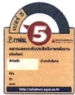
ฉลากประหยัดไฟเบอร์ ๕