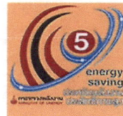
ฉลากพลังงานประสิทธิภาพสูง