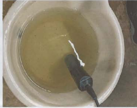
จุดเก็บตัวอย่างน้ำทิ้ง จุดที่ ๑ บ่อพักน้ำทิ้งของระบบบำบัดน้ำเสียที่จะระบายลงสู่รางระบายน้ำรอบอาคาร