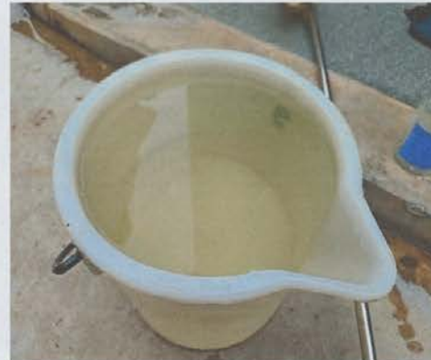
จุดเก็บตัวอย่างน้ำทิ้ง จุดที่ ๒ บ่อพักน้ำทิ้งที่จะระบายออกสู่ภายนอกของสถานีสูบน้ำริมถนนสามเสน