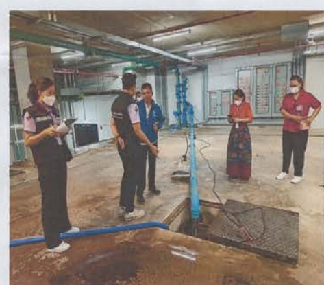
เจ้าหน้าที่ตรวจสอบระบบบำบัดน้ำเสียของอาคารรัฐสภาแห่งใหม่ สืบปายะสภาสถาน