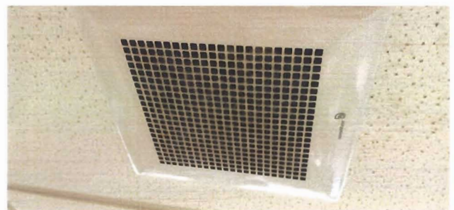
ภาพที่ ๓ ขั้นตอนการถอดแaggerงและหน้ากากพัดลมดูดอากาศ (ก่อนทำความสะอาด)