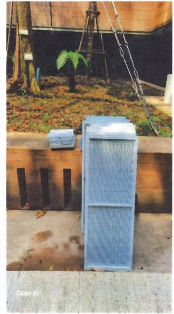
ภาพที่ ๔ ขั้นตอนการล้างทำความสะอาดตะแกรงช่องลมและหน้ากากพัดลมดูดอากาศ