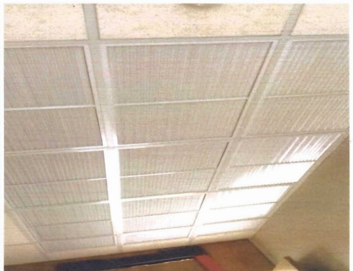
ภาพที่ ๕ ตะแกรงช่องลมกลับเครื่องปรับอากาศ (หลังทำความสะอาด)