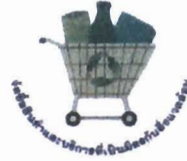
ตะกร้าเขียว