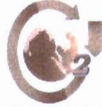
ฉลากลดคาร์บอนฟุตพริ้นท์