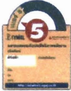
ฉลากประหยัดไฟเบอร์ ๕