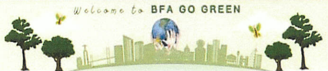
ภาพข่าวกิจกรรม

ในเดือนธันวาคม...สำนักงานสีเขียว (Green Office) สำนักการต่างประเทศ สำนักงานเลขาธิการวุฒิสภา