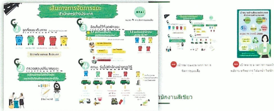
พนักงานสีเขียว