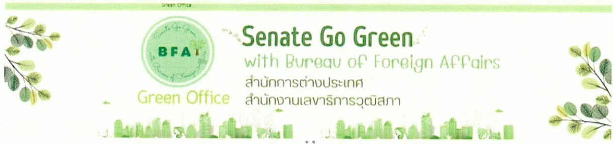
ยินดีต้อนรับ...สำนักงานสีเขียว (Green Office) สำนักการต่างประเทศ สำนักงานเลขาธิการวุฒิสภา

สินค้าและบริการที่เป็นมิตรกับสิ่งแวดล้อม