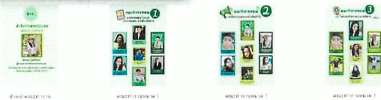
WELLY TO YUNA 1A 1