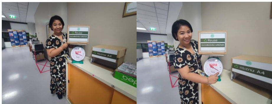
(๑) นำกระดาษใช้แล้วหน้าเดียว นำไปใช้ซ้ำเป็นกระดาษ Reuse รวมทั้งสิ้น ๓.๘ กิโลกรัม