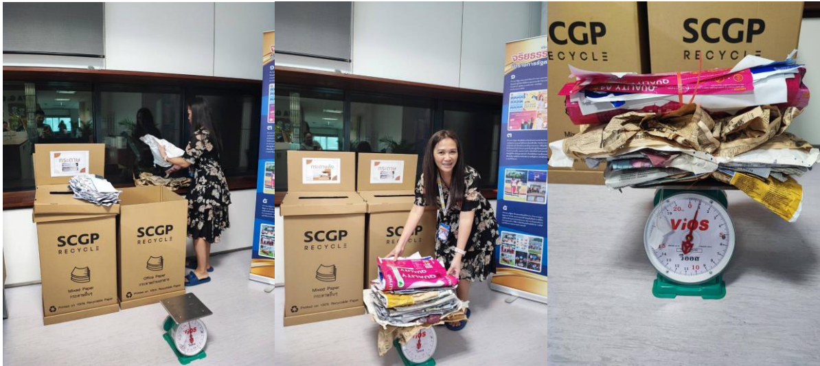
๖) ป้ายไว้นิรนามา Upcycle เป็นที่คลุมห่อเครื่องปริ้นท์เตอร์ จำนวน 4 กิโลกรัม