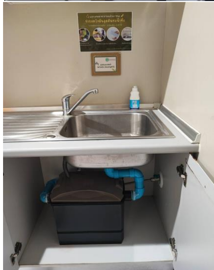
จำนวน ๑ จุด ณ บริเวณห้องครัว (ล้างจาน) ชั้น ๔ สำนักงานต่างประเทศ