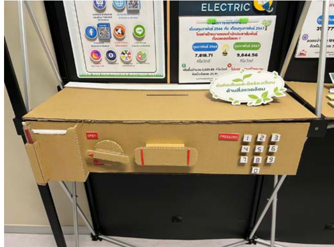
บริเวณชั้น 2