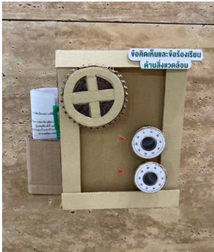
บริเวณชั้น 1