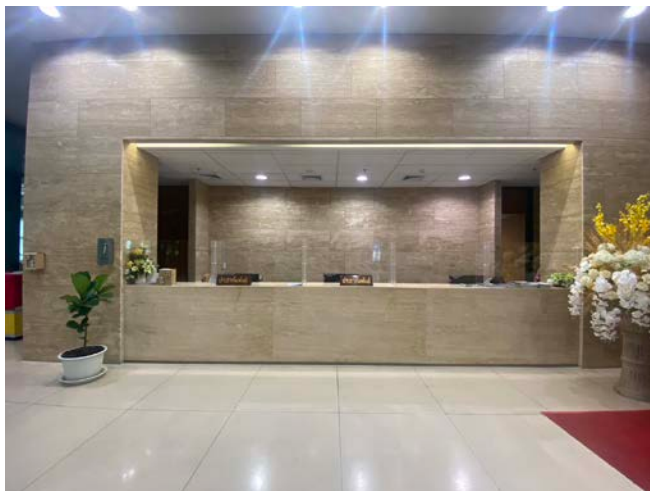
บริเวณชั้น 1