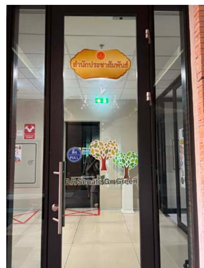
บริเวณชั้น 2