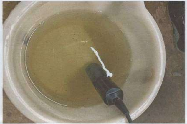
จุดเก็บตัวอย่างน้ำทิ้ง จุดที่ ๑ บ่อพักน้ำทิ้งของระบบบำบัดน้ำเสียที่จะระบายลงสู่รางระบายน้ำรอบอาคาร