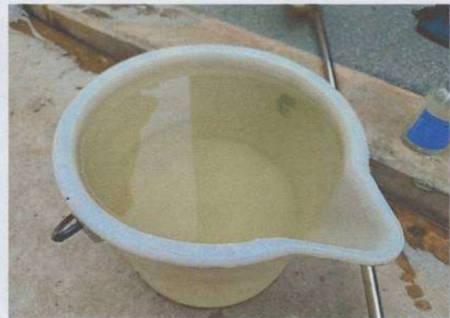
จุดเก็บตัวอย่างน้ำทิ้ง จุดที่ ๒ บ่อพักน้ำทิ้งที่จะระบายออกสู่ภายนอกของสถานีสูบน้ำริมถนนสามเสน