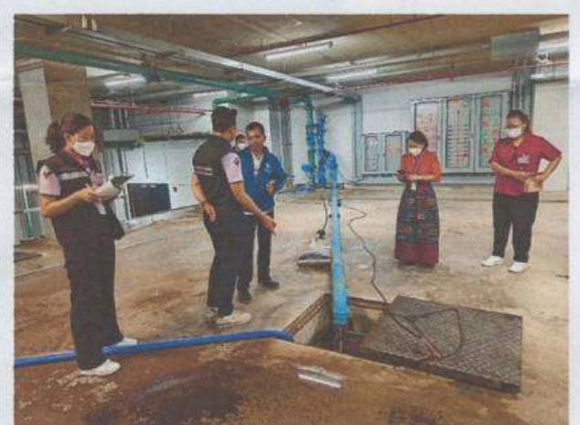
เจ้าหน้าที่ตรวจสอบระบบบำบัดน้ำเสียของอาคารรัฐสภาแห่งใหม่ สัปปายะสภาสถาน