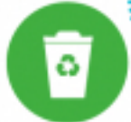
หมวด 4 การพิจารณาเรื่อง