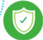
หมวด 5 สภาพแวดล้อม และความปลอดภัย