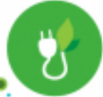
หมวด 3 การใช้ทรัพยากร และสิ่งแวดล้อม