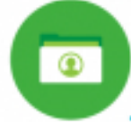
หมวด 1 การกำหนดนโยบาย การวางแผนการดำเนินงาน และการปรับปรุงอย่างต่อเนื่อง

ผู้บังคับบัญชาจากกลุ่มงานผลิตเอกสารเผยแพร่ หัวหน้าคณะทำงาน