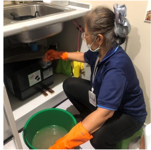
จุดที่ ๒ ภายในห้องครัว ชั้น ๒