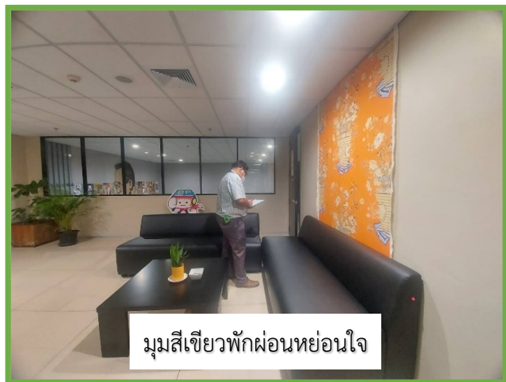
มุมสี่เหลี่ยมพักผ่อนหย่อนใจ