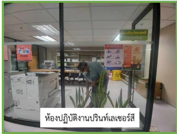
ห้องปฏิบัติงานปริ้นท์เลเซอร์สี

ภาพการตรวจสอบว่าไม่มีก้นบุหรี่ถูกทิ้งหรือตกอยู่นอกเขตสูบบุหรี่ บริเวณ ชั้น MB๑