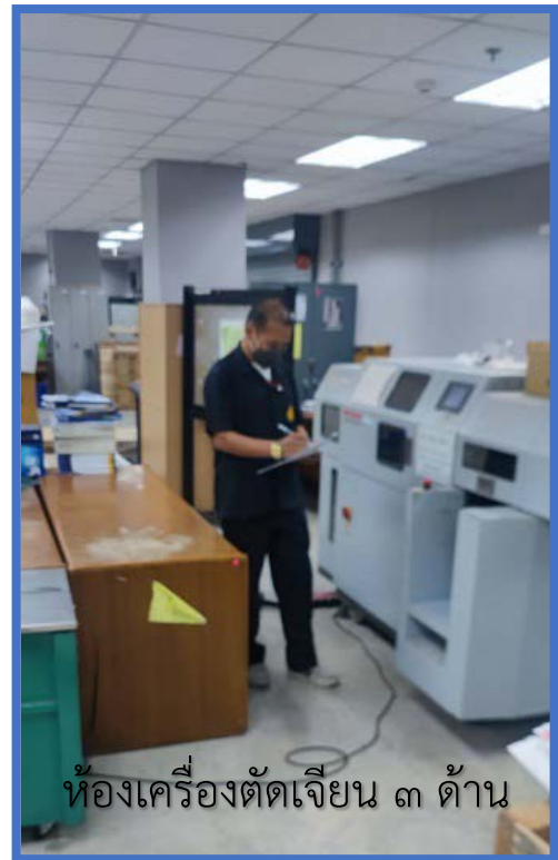
ห้องเครื่องตัดเจียน ๓ ด้าน