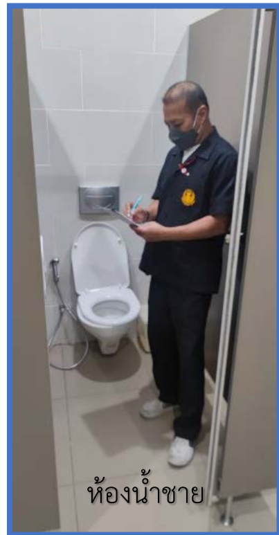
ห้องน้ำชาย