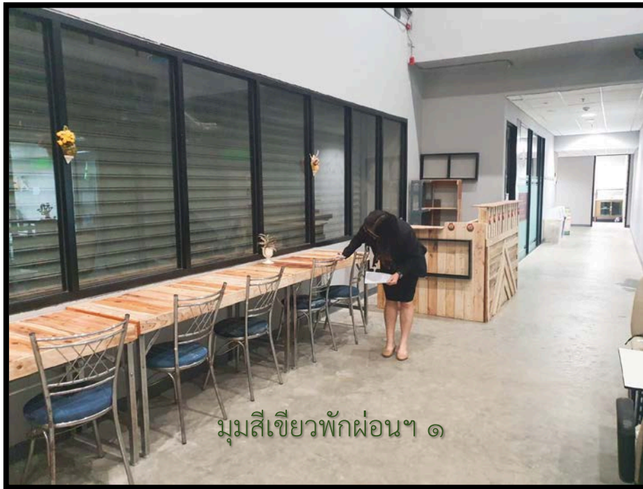
มุมสี่เหลี่ยมพักผ่อนฯ ๑