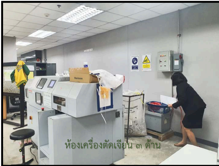
ห้องเครื่องตัดเงิน ๓ ด้าน

นายธนกฤต ลีชะวณิช หัวหน้าทีมตรวจสอบสัตว์พาหะนำโรค สำนักการพิมพ์ ผู้รายงาน