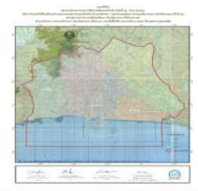
พื้นที่เขตควบคุมมลพิษมาบตาพุดจังหวัดระยอง

ปัญหาคือมีการประกาศ “เขตควบคุมมลพิษจังหวัดระยอง” ในพื้นที่ อปท. “ได้แก่ ประกอบด้วย องค์การปกครองส่วนท้องถิ่นประเภทเทศบาลนคร (บางส่วน) เทศบาลเมืองและเทศบาลตำบล ๘ แห่ง ได้แก่ เทศบาลนครระยอง (บางส่วน) เทศบาลเมืองมาบตาพุด เทศบาลเมืองบ้านฉาง เทศบาลตำบลเนินพระ เทศบาลตำบลบ้านฉาง เทศบาลตำบลทับมา เทศบาลตำบลมาบข่าพัฒนา และเทศบาลตำบลมาบข่า และชุมชนต่าง ๆ กว่า ๖๗ ชุมชน มีประชากรประมาณ ๑๗๘,๐๐๐ คน มีพื้นที่ประมาณ ๔๑๗ ตารางกิโลเมตร เนื่องจากศาลปกครองสั่งให้ กวลง. ประกาศ เป็นเขตควบคุมมลพิษ เนื่องจากภาคประชาชนร้องเรียน ตั้งแต่ปี พ.ศ. ๒๕๕๒ เพราะมีปัญหามลพิษทางอากาศ (สาร VOCS เกินมาตรฐาน) มลพิษทางน้ำจากน้ำเสีย และ กากอุตสาหกรรม