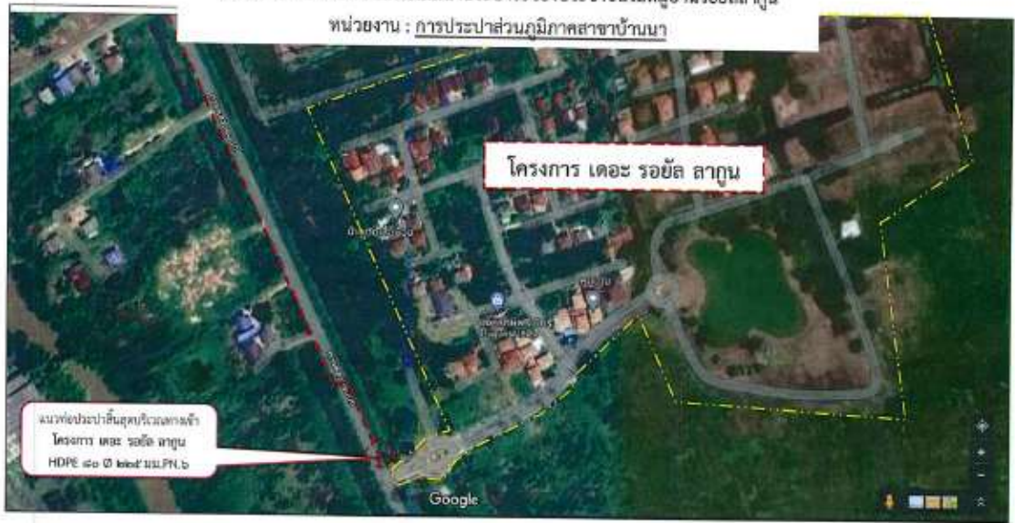
กรณีความเดือดร้อนจากการไม่มีน้ำประปาใช้ของประชาชนในหมู่บ้านรอยัลลาگون หน่วยงาน : การประปาส่วนภูมิภาคสาขาบ้านนา