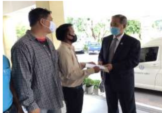
การหารือร่วมกับส่วนราชการและประชาชน เข้าพบผู้ว่าราชการจังหวัด และรับเรื่องร้องเรียนจากประชาชน