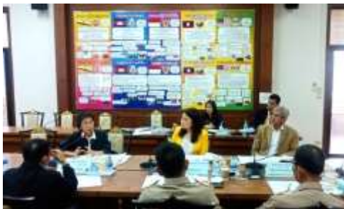
การหารือร่วมกับรองผู้ว่าราชการจังหวัดและส่วนราชการจังหวัด