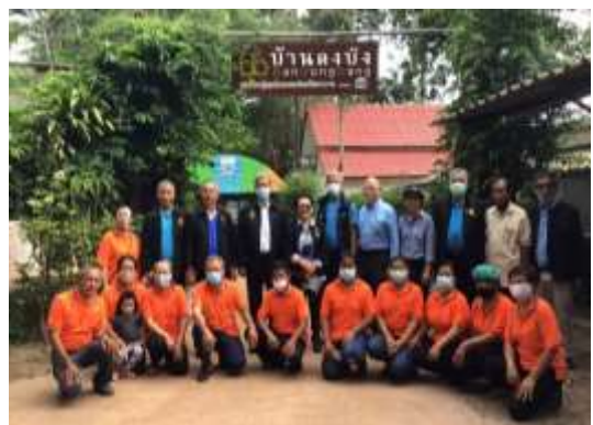
ร่วมโครงการการสนับสนุนอุปกรณ์การเพิ่มผลผลิตกลุ่มชุมชน “บ้านดงบัง” หมู่บ้านสมุนไพรเกษตรอินทรีย์เพื่อสุขภาพและสิ่งแวดล้อม จังหวัดปราจีนบุรี