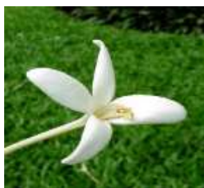
ดอกไม้ประจำจังหวัด คือ ดอกปิบ ชื่อสามัญ Cork Tree

ดอกปิบ หรือภาคเหนือเรียกว่า กาะชะลอง กาดสะลอง ภาคกลางเรียกปิบ ภาษากะเหรี่ยง (กาญจนบุรี) เรียกว่า เด็กดองโห้ ลักษณะทั่วไป เป็นไม้ยืนต้นขนาดกลางถึงขนาดใหญ่ลำต้นสูงประมาณ ๑๐ - ๒๐ เมตร เปลือกลำต้นสีเทาขรุขระ ใบออกเป็นช่อลักษณะใบกลมรี ขอบใบเรียบโคนใบมน ใต้ใบเห็นเส้นใบชัดเจน ดอกออกเป็นช่อตั้งตรง ลักษณะเป็นท่อยาวประมาณ ๒ - ๓ นิ้ว สีขาวปนเหลืองขนาด ๒ เซนติเมตร ปลายกลีบดอกเป็นแฉก ๕ แฉก ตรงกลางดอกมีเกสรตัวผู้และเกสรตัวเมียติดอยู่ด้านในใกล้ปากท่อ ผลมีลักษณะเป็นฝักแบน ภายในมีเมล็ดลักษณะแบนขยายพันธุ์โดยการเพาะเมล็ดและการปักชำ เหมาะที่จะปลูกในพื้นที่ที่มีดินร่วนซุย แสงแดดจัดหรือกลางแจ้งมีถิ่นกำเนิดในประเทศไทยและประเทศ