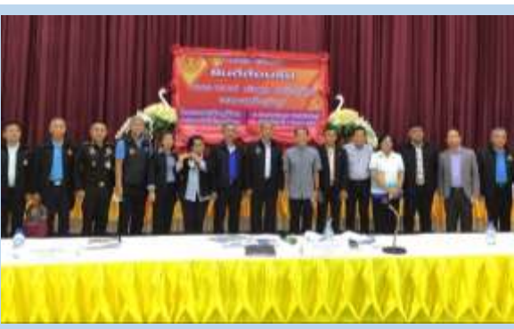
การหารือร่วมกับส่วนราชการและประชาชน ณ ที่ว่าการอำเภอประจันตคาม จังหวัดปราจีนบุรี