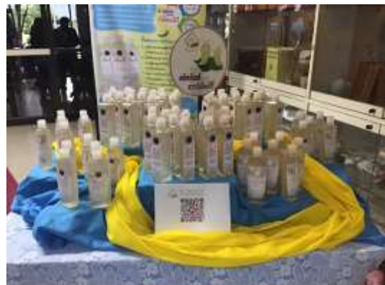
ร่วมชมนิทรรศการของกลุ่มผู้เลี้ยงไหมอີรี่ ชุมชนท่ากะบาก จัดโดยวิทยาลัยชุมชนสระแก้ว จังหวัดสระแก้ว