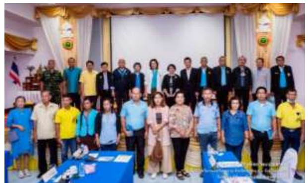
การหารือร่วมกับส่วนราชการและประชาชน ณ ห้องประชุมวิทยาลัยชุมชนสระแก้ว จังหวัดสระแก้ว