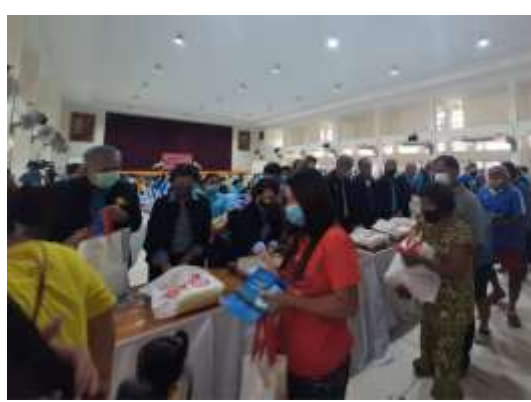
แจกข่าวสารและถุงยังชีพ แก่ประชาชนจำนวน ๑๐๐ คน