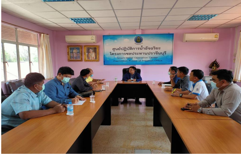
ภาพประชุมร่วมกับหน่วยงานที่เกี่ยวข้อง