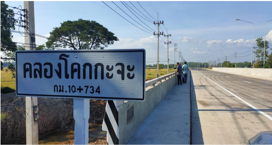
ภาพลงพื้นที่สำรวจเส้นทางการดำเนินงาน