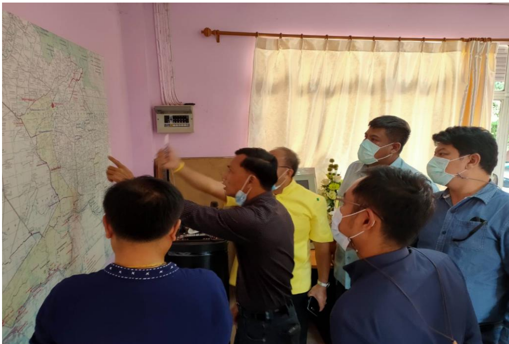
ภาพการนำเสนอแนวทาง