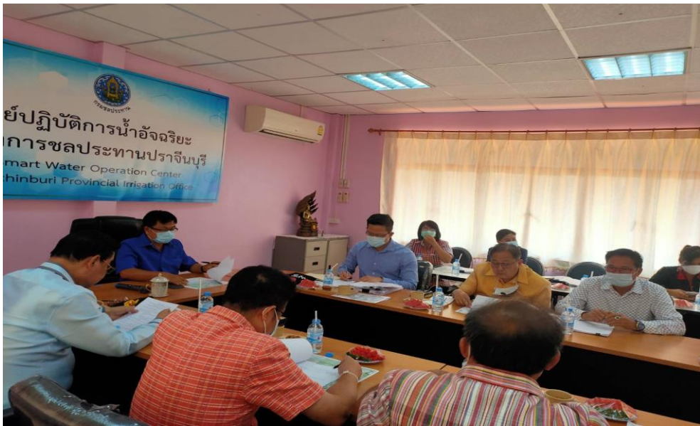
ภาพหน่วยงานส่วนท้องถิ่น นายกองค้การบริหารส่วนจังหวัดและหน่วยงานราชการเข้าร่วมหารือ