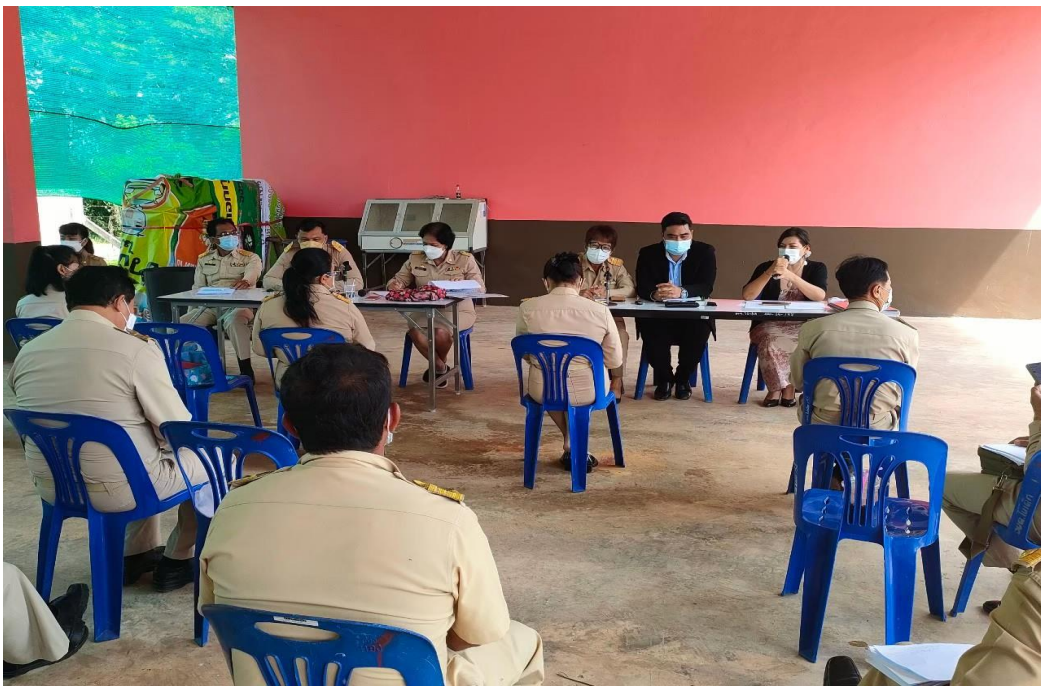
ภาพประชุมชี้แจงกับผู้นำชุมชนต่อปัญหาภัยแล้งและการเตรียมการรับมือ