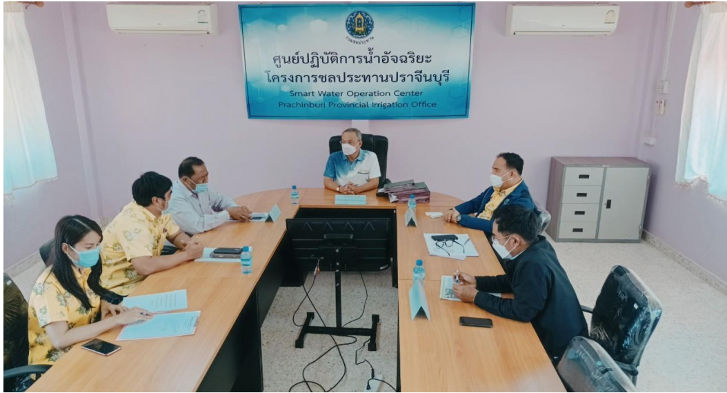
ภาพร่วมหารือการดำเนินโครงการ

สุดท้ายนี้ทางคณะทีมงานพื้นที่ต้องขอขอบพระคุณคณะกรรมการโครงการสมาชิกวุฒิสภาพบประชาชนในพื้นที่จังหวัดภาคตะวันออก ณ จังหวัดปราจีนบุรี ที่ได้ติดตามความคืบหน้าและขอภัยในความไม่สะดวกมา ณ ที่นี้ด้วย