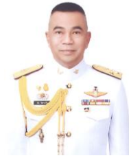
พลเอก ณ์ัฐ อินทรเจริญ ที่ปรึกษาคณะกรรมการ