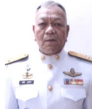
พลอากาศเอก มนัส รูปขจร ที่ปรึกษาคณะอนุกรรมการ