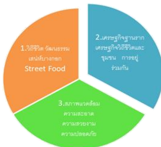
ภาพที่ ๑.๑ มิติที่เกี่ยวข้องกับเรื่องหาบเร่แผงลอย

เมื่อพิจารณาเรื่องหาบเร่แผงลอย มีมิติที่เกี่ยวข้อง ๓ มิติ ดังนี้