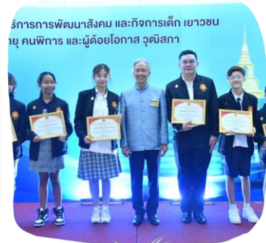
กรรมการพัฒนาศักยภาพ และกิจการเด็ก เยาวชน ผู้ คนพิการ และผู้ด้อยโอกาส วุฒิสภา