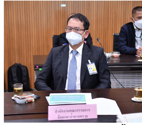
สำนักงานคณะกรรมการอัยและนำตาสทราย