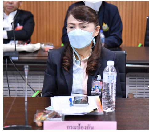
กรมป้องกันและบรรเทาสาธารณภัย