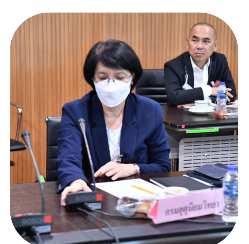
กรมอุตุนิยมวิทยา

“การพัฒนาที่ยั่งยืนต้องสมดุลกับธรรมชาติและเป็นมิตรกับสิ่งแวดล้อม”