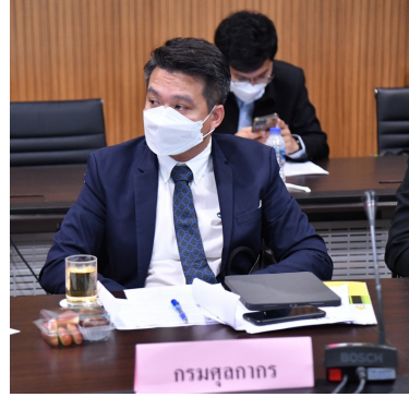
กรมศุลกากร