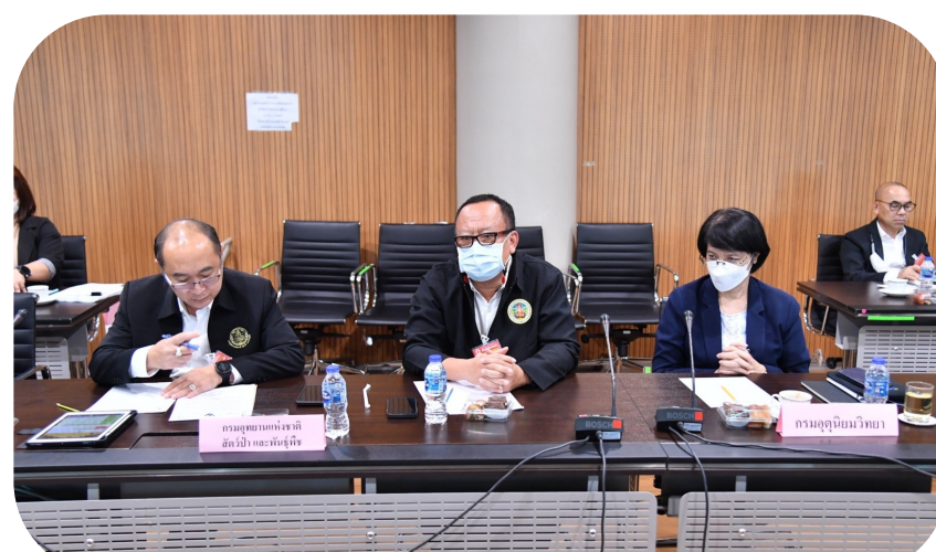
กรมอุทยานแห่งชาติ สัตว์ป่า และพันธุ์พืช