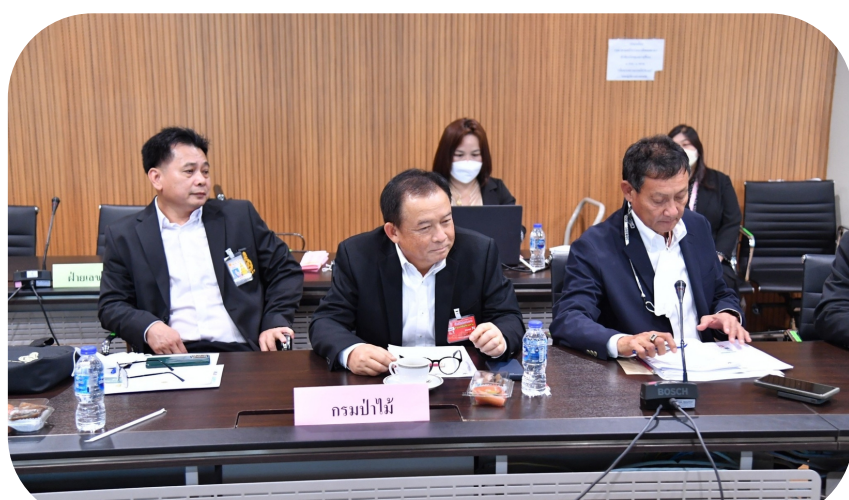
กรมป่าไม้