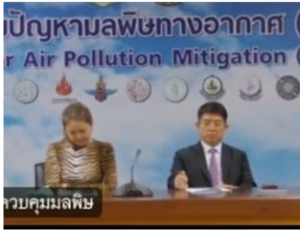
กรมควบคุมมลพิษ