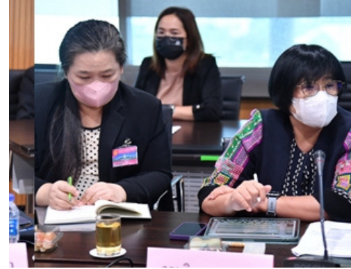
กรมวิชาการเกษตร

หน่วยงานที่เข้าร่วมประชุมได้ให้ข้อมูลว่า ข้อมูลดาวเทียมจุดความร้อนจากภาพถ่ายดาวเทียมและการนำไปใช้ประโยชน์ เป็นการรับสัญญาณ และการวิเคราะห์จุดความร้อนจากดาวเทียมSUOMI NPP SUOMI NPP SUOMI NPP ระบบ VIIRS NOAA -20 และพื้นที่เผาไหม้ด้วย LANDSAT LANDSAT-9 โดยการรายงานข้อมูลจุดความร้อน (HOTSPOT) ประจำปี ๒๕๖๖ แบ่งเป็น ๓ พื้นที่ ได้แก่ ๑) เมือง คือ พื้นที่ริมทางหลวง ชุมชนและอื่นๆ ๒) ป่า คือ ป่าสงวนแห่งชาติ และป่าอนุรักษ์ ๓) เกษตรคือ พื้นที่เกษตร และเขต สปก.