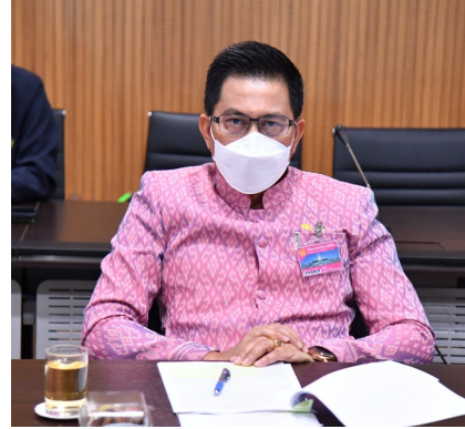
กรมส่งเสริมการปกครองท้องถิ่น