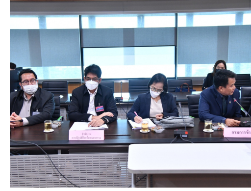
กรมการข่าว