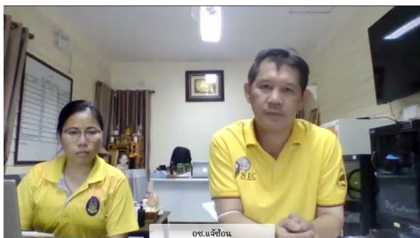
อุทยานแห่งชาติแจ้ซ้อน