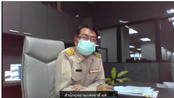
ผู้อำนวยการส่วนแผนงานอุทยานแห่งชาติ