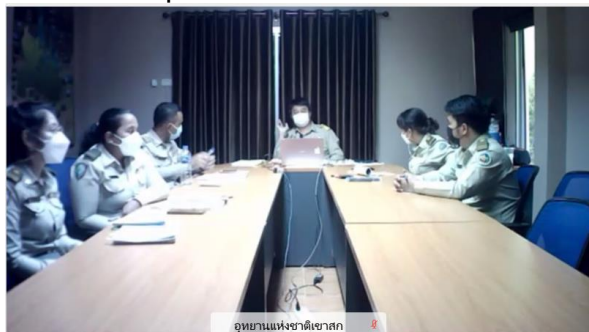
อุทยานแห่งชาติเขาสก

ส่วนแผนบริหารจัดการขีดความสามารถในการรองรับของพื้นที่ (Carrying Capacity) ของอุทยานแห่งชาติแจ้ซ้อน ได้กำหนดขีดความสามารถในการรองรับของพื้นที่ด้านกายภาพ โดยข้อมูลทางกายภาพที่นำมาใช้ในการประเมินขีดความสามารถในการรองรับนักท่องเที่ยว ได้แก่ ขนาดของเนื้อที่สำหรับรองรับการประกอบกิจกรรมนันทนาการ ระยะเวลาในการประกอบกิจกรรม โดยคิดเป็นจำนวนคนต่อการใช้ประโยชน์ในช่วงเวลาเดียวกัน ประกอบกับขีดความสามารถในการรองรับด้านจิตวิทยา (ประเมินโดยใช้ความรู้สึกหนาแน่นของนักท่องเที่ยวภายในพื้นที่ที่ใช้ประโยชน์เดียวกัน) โดยกำหนดขีดความสามารถในการรองรับนักท่องเที่ยวแต่ละบริเวณ ดังนี้