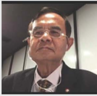
พลเรือเอก พงศ ไชยครดา รองประธาน คนที่หนึ่ง