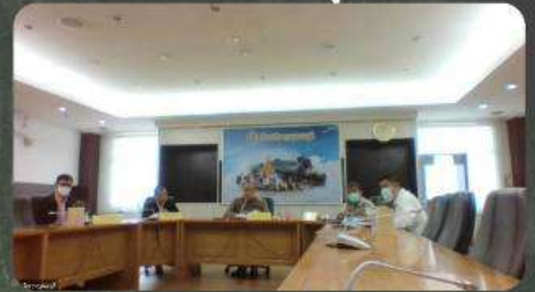
นายธณภพ เวียงสิมมา รองผู้ว่าราชการจังหวัดกาญจนบุรี