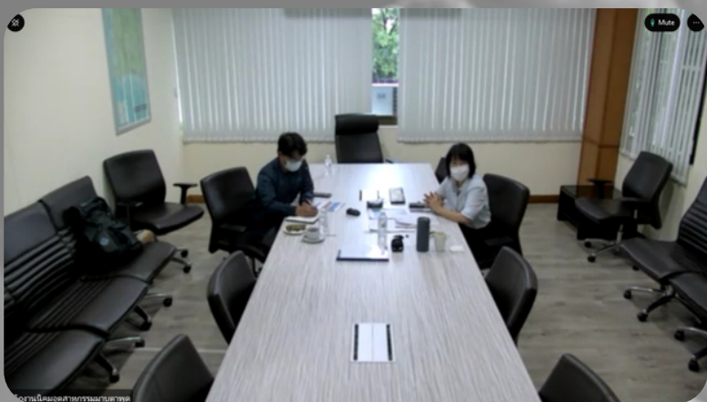
สำนักงานนิคมอุตสาหกรรมมาบตาพุด