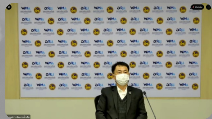
องค์การบริหารน้ำเสีย