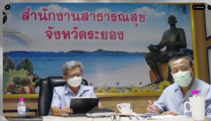
นายแพทย์สาธารณสุขจังหวัดระยอง