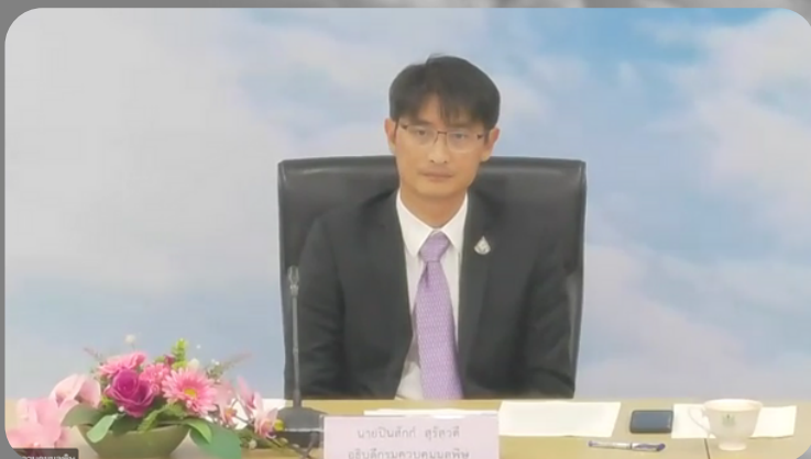
กรมควบคุมมลพิษ

๒. พิจารณาติดตาม เสนอแนะ และเร่งรัดผลการดำเนินการตามแผนการปฏิรูปประเทศ และการดำเนินการตามยุทธศาสตร์ชาติด้านทรัพยากรธรรมชาติและสิ่งแวดล้อม กิจกรรมปฏิรูปประเทศ ที่จะส่งผลให้เกิดการเปลี่ยนแปลงต่อประชาชนอย่างมีนัยสำคัญ (BIG ROCK) กิจกรรมที่ ๔ ปฏิรูประบบ การบริหารจัดการเขตควบคุมมลพิษ กรณีเขตควบคุมมลพิษมาบตาพุด โดยเชิญ ผู้แทนส่วนราชการ ที่เกี่ยวข้อง มาให้ข้อมูลต่อที่ประชุม