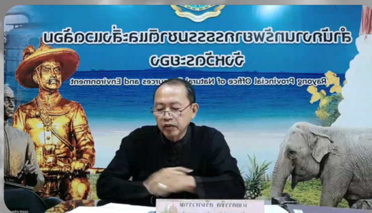
ผอ.สำนักงานทรัพยากรธรรมชาติและสิ่งแวดล้อมจังหวัดระยอง