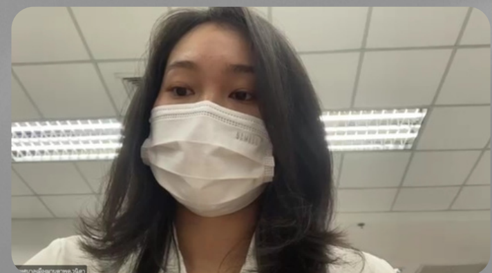
เทศมนตรีเมืองมาบตาพุด