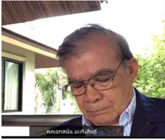
พลเอกสนั่น นเรศวรสิงห์