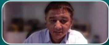
นายworngk สิบปีกบปาลี อนุกรรมการ