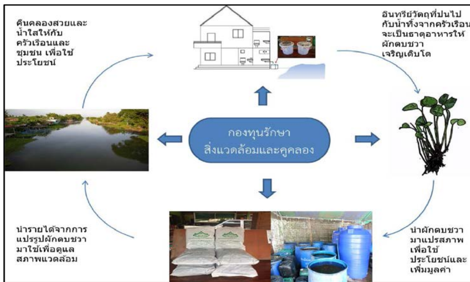
ภาพแสดงการจัดการผักตบชวาของชุมชนบ้านศาลาดิน

- กระจายรายได้สู่ชุมชนแล้วไม่ต่ำกว่า ๔๓๐,๕๒๐ บาท