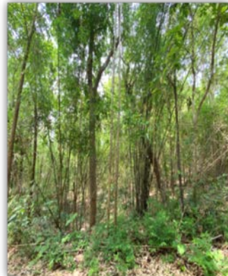
ป่าเบญจพรรณ