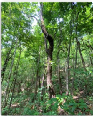
ป่าเต็งรัง

พื้นที่ป่าชุมชนบ้านพุเตย-บ้านพุราด อยู่ในพื้นที่ป่าไม้ตามพระราชบัญญัติป่าไม้ พุทธศักราช ๒๕๕๔ ได้รับการอนุมัติโครงการฯ ครั้งแรก เมื่อวันที่ ๑๔ กันยายน ๒๕๕๔ เนื้อที่ ๓๗๕ ไร่ และได้ขยายพื้นที่เพื่อขอต่ออายุโครงการป่าชุมชน ครั้งที่ ๒ อนุมัติเมื่อวันที่ ๒๘ ตุลาคม ๒๕๖๒ เนื้อที่ ๔๑๐ ไร่ ๕๔ ตารางวา โดยมีการแบ่งบริเวณพื้นที่ป่าชุมชนเป็น ๓ บริเวณ ได้แก่ (๑) บริเวณเพื่อการอนุรักษ์แบบเข้มข้น (๒) บริเวณเพื่อการอนุรักษ์ และ (๓) บริเวณเพื่อการใช้ประโยชน์ ทั้งนี้ พื้นที่ป่าเป็นแหล่งรวมทรัพยากรธรรมชาติ ๓ ป่า (ป่าเต็งรัง ป่าเบญจพรรณ ป่าพรุ) ให้กลายเป็น “หนึ่งป่าชุมชน” อีกด้วย