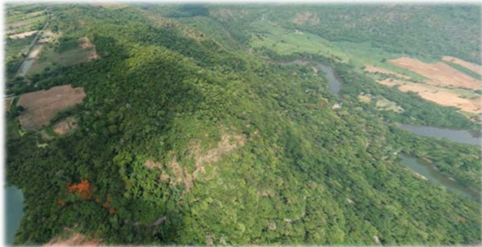
ภาพถ่ายทางอากาศป่าชุมชนพุเตย - พุราด ปี ๒๕๖๓

ป่าชุมชนบ้านพุเตย - พุราด ตั้งอยู่ในท้องที่ หมู่ที่ ๗ , ๘ และ ๑๑ ตำบลท่าเสา อำเภอไทรโยค จังหวัดกาญจนบุรี ซึ่งอยู่ด้านหลังโรงเรียนบ้านพุเตย และหลังวัดพุเตย เป็นพื้นที่อยู่นอกเขตอุทยานแห่งชาติไทรโยค สภาพป่าเป็นป่าเบญจพรรณ มีพรรณไม้หลากหลายชนิดอยู่ในพื้นที่ เช่น ประดู่