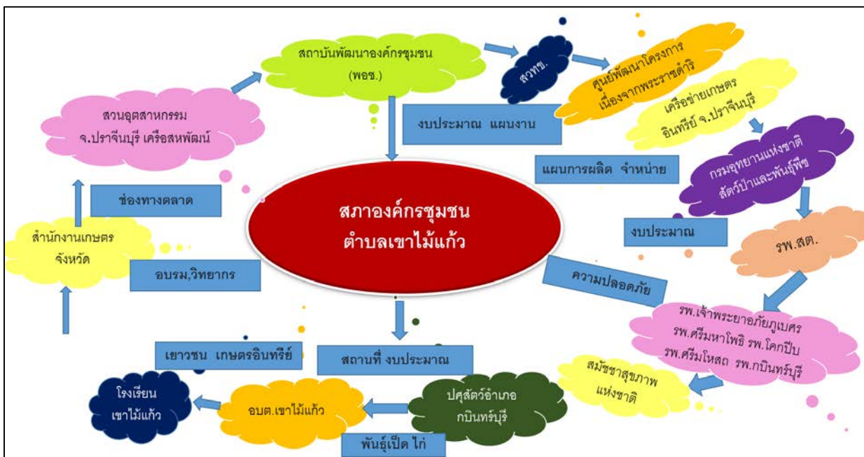
ผังภาพกลไกการเชื่อมโยงตำบลเขาไม้แก้ว