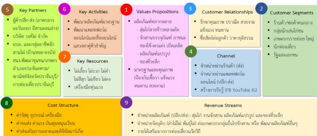
ผังภาพแบบจำลองธุรกิจ (Business Model Canvas)

สำหรับกลยุทธ์และแนวปฏิบัติ (Strategies & Operational Approaches) ใช้รูปแบบภายใต้แนวคิด “สอน สร้าง สุข” มาใช้เป็นกลไกการขับเคลื่อน ดังนี้