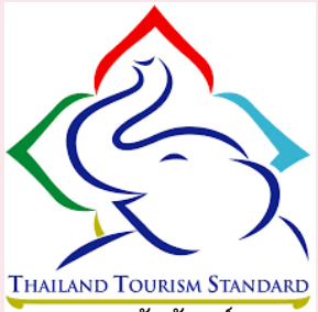
ตราสัญลักษณ์ Thailand Tourism Standard

ผู้แทนกรรมการท่องเที่ยว ได้ให้ข้อมูลต่อที่ประชุมว่า สำหรับเรื่องสิทธิมนุษยชน กรรมการท่องเที่ยว ได้มีการจัดทำมาตรฐานการท่องเที่ยวของประเทศไทย เรียกว่า “Thailand Tourism Standard” ซึ่งครอบคลุมกิจกรรมหลัก ๓ ด้าน ได้แก่ แหล่งท่องเที่ยว บริการท่องเที่ยว และธุรกิจนำเที่ยว หรือมัคคุเทศก์ ซึ่งได้มีการกำหนดมาตรฐานทั้งหมด ๕๖ มาตรฐาน โดยการตรวจสอบจะประกอบด้วย ด้านความปลอดภัย ด้านการบริการที่ดีเลิศ ด้านสิ่งแวดล้อม และด้านการบริหารจัดการ โดยเห็นว่า หากมีการนำหลักเกณฑ์ Thailand Tourism Standard ซึ่งได้มีการกำหนดเกี่ยวกับเรื่องสิทธิมนุษยชนไว้บางส่วนแล้ว มารวมกับหลักเกณฑ์เรื่องธุรกิจกับสิทธิมนุษยชน สามารถที่จะดำเนินการได้ หรือสามารถจะดำเนินการต่อยอด โดยผู้ประกอบการที่ได้รับใบรับรอง Thailand Tourism Standard สามารถที่จะไปขอใบรับรองมาตรฐานธุรกิจกับสิทธิมนุษยชนอีกหนึ่งใบก็ได้ เพื่อให้เกิดความเด่นชัดในเรื่องดังกล่าว ทั้งนี้ เห็นว่าสามารถที่จะนำหลักเกณฑ์ทั้งสองเรื่องดังกล่าวไปรวมกันเพื่อออกใบรับรองมาตรฐานให้แก่ผู้ประกอบการ และยินดีที่จะร่วมขับเคลื่อนในเรื่องธุรกิจกับสิทธิมนุษยชน