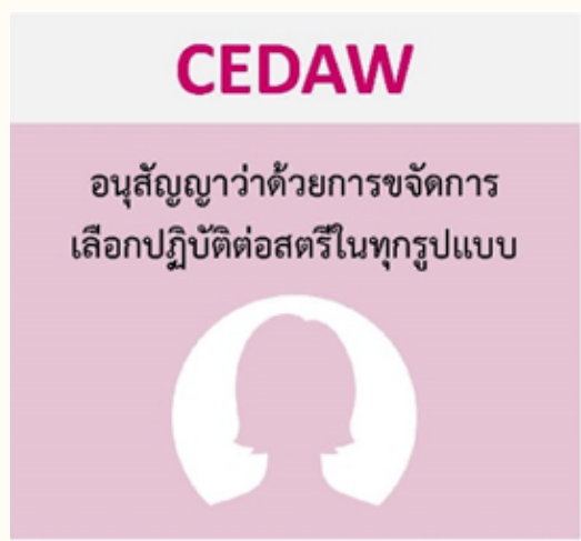
กรมกิจการสตรีและสถาบันครอบครัว