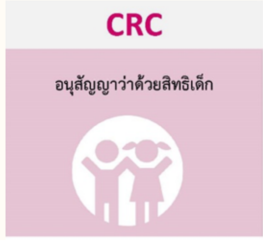
กรมกิจการเด็กและเยาวชน