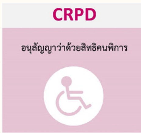
กรมส่งเสริมและพัฒนาคุณภาพชีวิตคนพิการ