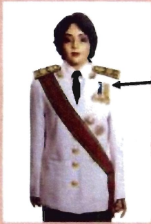
เครื่องแบบเต็มยศ

ประดับดารา ดวงตรา และสวมสายสะพายเช่นเดิม เหรียญราชอิสริยาภรณ์ เช่น เหรียญที่พระราชทาน เป็นที่ระลึกในโอกาสต่าง ๆ ให้ประดับโดยใช้แพรแถบแบบบุรุษ