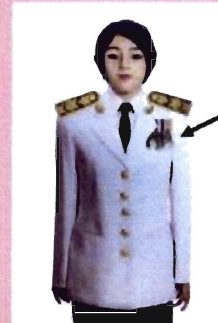
เครื่องแบบเต็มยศและครึ่งยศ

ประดับแพรแถบ เหรียญที่พระราชทานเป็นที่ระลึก ในโอกาสต่าง ๆ แบบบุรุษ ที่อกเสื้อเบื้องซ้าย