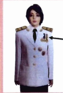
เครื่องแบบครึ่งยศ

ประดับดารา ดวงตรา และสวมสายสะพายเช่นเดิม เหรียญราชอิสริยาภรณ์ เช่น เหรียญจักรพรรดิมาลา เหรียญที่พระราชทานเป็นที่ระลึก ในโอกาสต่าง ๆ ให้ประดับโดยใช้แพรแถบ แบบบุรุษ