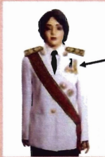
เครื่องแบบเต็มยศ

ประดับดารา ดวงตรา และสวมสายสะพายเช่นเดิม เหรียญราชอิสริยาภรณ์ เช่น เหรียญจักรพรรดิมาลา เหรียญที่พระราชทานเป็นที่ระลึก ในโอกาสต่าง ๆ ให้ประดับโดยใช้แพรแถบ แบบบุรุษ