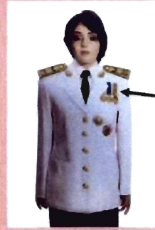
เครื่องแบบครึ่งยศ

ประดับดารา ดวงตรา และสวมสายสะพายเช่นเดิม เหรียญราชอิสริยาภรณ์ เช่น เหรียญที่พระราชทาน เป็นที่ระลึกในโอกาสต่าง ๆ ให้ประดับโดยใช้แพรแถบแบบบุรุษ