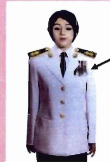
เครื่องแบบเต็มยศและครึ่งยศ

ประดับแพรแถบ เหรียญที่พระราชทานเป็นที่ระลึก ในโอกาสต่าง ๆ แบบบุรุษ ที่อกเสื่อเบื้องซ้าย