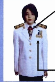
เครื่องแบบเต็มยศและครึ่งยศ (ประดับเครื่องราชอิสริยาภรณ์เหมือนกัน)

เช่น ต.ช., ต.ม. (เดิมประดับหน้าบ่าเสื่อ)