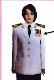
เครื่องแบบเต็มยศและครึ่งยศ (ประดับเครื่องราชอิสริยาภรณ์เหมือนกัน)

เช่น จ.ช., จ.ม., บ.ช., บ.ม., ร.ท.ช., ร.ท.ม., ร.จ.ช., ร.จ.ม.