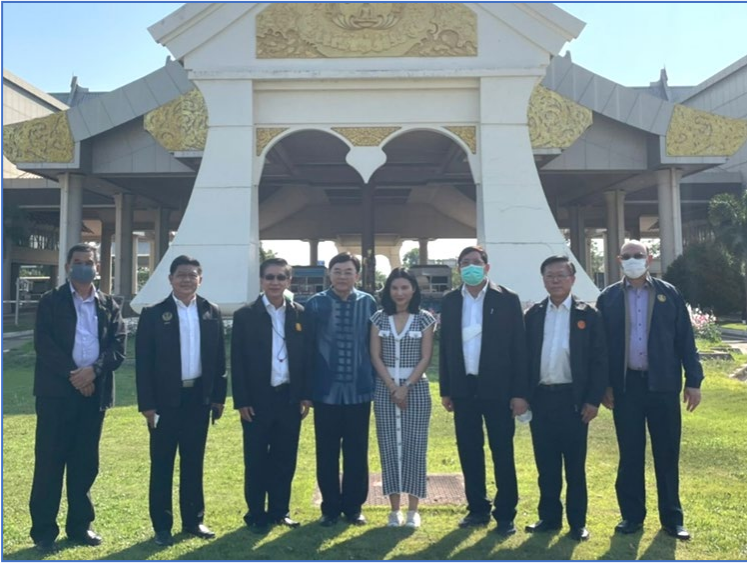
คณะอนุกรรมการเยี่ยมชมเส้นทางรถขนส่งสินค้าในพื้นที่ เขตเศรษฐกิจพิเศษนครพนม ณ สะพานมิตรภาพ แห่งที่ 3 (นครพนม – คำม่วน)