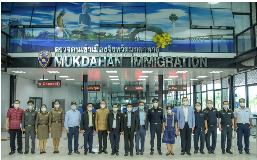
คณะอนุกรรมการเยี่ยมชมเส้นทางการขนส่งสินค้า ในพื้นที่เขตเศรษฐกิจพิเศษมุกดาหาร ณ สะพานมิตรภาพแห่งที่ 2 (มุกดาหาร – สะหวันนะเขต)

4. การเพิ่มศักยภาพในการผลิตสินค้าเพื่อการส่งออก เห็นว่า ควรมีการส่งเสริมการลงทุนในอุตสาหกรรมการผลิตสินค้าส่งออกอันดับแรก คือ เครื่องประมวลผลและหน่วยเก็บข้อมูลในปี 2564 มีการส่งออก มากถึง 133,827 ล้านบาท ในส่วนนี้ หากเป็นการผลิตเพื่อส่งออกของสินค้าในพื้นที่จังหวัดมุกดาหารเองจะส่งผลให้ผลิตภัณฑ์มวลรวมของพื้นที่มุกดาหารสูงขึ้นได้อย่างแท้จริง นอกจากนั้น ในประเด็นของการส่งเสริมการผลิตในพื้นที่ ควรมีการตั้งโรงงานเพื่อการผลิต เช่น การผลิตเครื่องตี๋มบำรุงกำลัง เป็นต้น เพื่อช่วยในเรื่องลดต้นทุนและระยะเวลาด้านการขนส่งไปยังต่างประเทศ