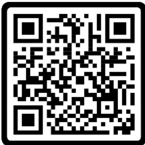
สรุปผลการเดินทาง