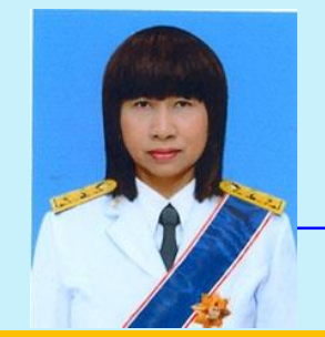
เลขาธิการวุฒิสภา น.ส.นภาพรณ์ ใจสัจจะ