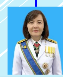
รองเลขาธิการวุฒิสภา นางนพเก้า สุขะนันท์