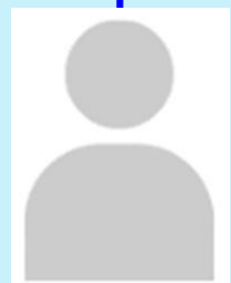
ที่ปรึกษาด้านระบบงานนิติบัญญัติ (กลุ่ม 1) -ว่าง-