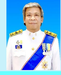
รองเลขาธิการวุฒิสภา นายพีระพจน์ รัตนมาลี