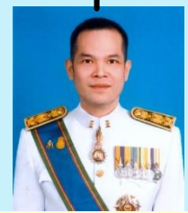
สำนักบริหารงานกลาง (นายรุ่งธรรม เปรมมางกูร)