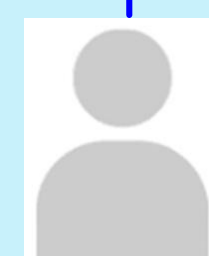
ที่ปรึกษาด้านระบบงานนิติบัญญัติ (กลุ่ม 2) -ว่าง-