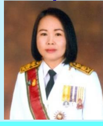
รองเลขาธิการวุฒิสภา นางปิ่นณิตา สหพันธ์ไตรภพ