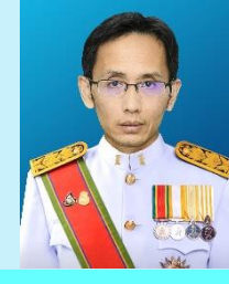
รองเลขาธิการวุฒิสภา นายทศพร แยมวงษ์