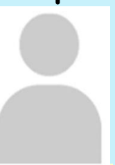
สำนักวิชาการ (-ว่าง-)