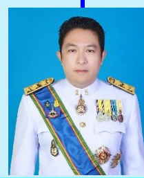
รองเลขาธิการวุฒิสภา นายต้นพงศ์ ตั้งเต็มทอง